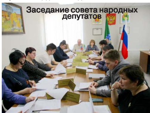
Заседание совета народных депутатов

На данный момент в тариф по содержанию и текущему ремонту общего домового имущества содержание контейнерных площадок не входит.