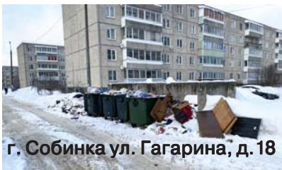
г. Собинка ул. Гагарина, д. 18